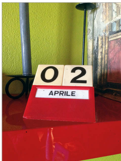
fig. 5. La necessità di marcare il passare di un tempo sospeso attraverso elementi tangibili che visualizzano lo scorrere dei giorni e, allo stesso tempo, interagiscono con lo spazio e la componente umana (Marzo-aprile 2020. Foto: A. Briano).