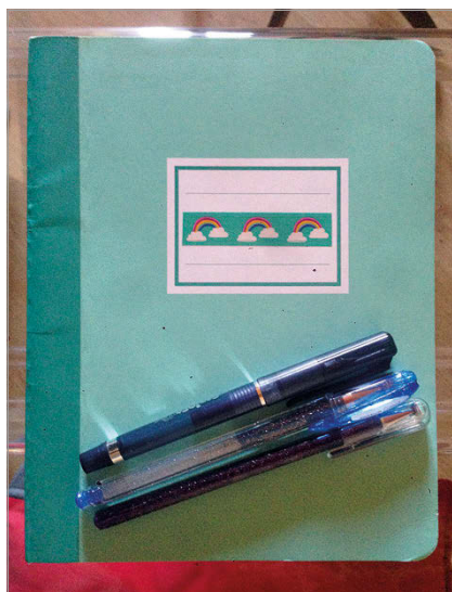
fig. 6. La pratica dello scrivere a mano, su carta, scegliendo con cura penne e matite. (Marzo-aprile 2020.).

non è garanzia di mantenimento, ma al contrario, produttrice di una sovrabbondanza di tracce digitali la cui gestione, in termini di processamento dati, viene trascurata.