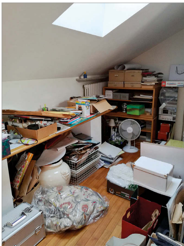
fig. 9. Profusioni domestiche. (Aprile 2020. Foto: S. Cantara).

2019, p. 16) e che la stessa agency agisca anche come un fattore di forza nei confronti dell'attenzione che dedichiamo a una cosa piuttosto che a un'altra.