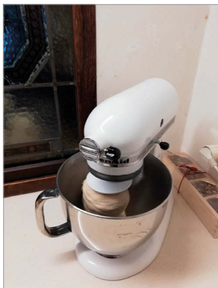
fig. 2. Una delle molte immagini che ritraggono strumenti e fasi del lavoro legate alle attività di panificazione e pasticceria (Marzo 2020. Foto: B.M. Sciré).

essenziali alla stregua di guardare film, serie tv, programmi televisivi e seguire le notizie al telegiornale. Un altro impegno costante è quello nella cura quotidiana di figli o nipoti, nell'aiuto con la didattica a distanza, nella costruzione di attività da fare per riempire le giornate interamente casalinghe. Infine, una parte delle donne ritaglia del tempo per non trascurare di praticare attività fisica. Sono completamente assenti riferimenti di carattere intimo: non vi è alcun rimando al sesso o ai momenti dedicati all'espletamento di bisogni fisiologici; anche nelle descrizioni più dettagliate si sorvola su queste parti della giornata. Gli oggetti riflettono questa assenza: non ci sono ad esempio rimandi al ciclo mestruale (assorbenti, tamponi, slip, ecc.), come del resto non compaiono anticoncezionali, preservativi, carta igienica; un'unica citazione richiama alla presenza di un vibratore.