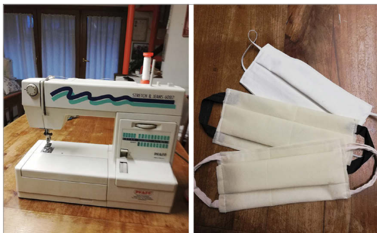
fig. 7. L'autoproduzione di mascherine di comunità. Strumenti e materiali. (Marzo 2020. Foto: B.M. Sciré).

alle mascherine protettive e ai guanti monouso. A questi oggetti sappiamo essere associate implicazioni culturali date dalla paura, dall'incertezza sul futuro e sulla salute, elementi che hanno inciso sia sul livello di mercificazione di questi beni, sia sulla loro connotazione simbolica. La mascherina e il gel diventano l'incarnazione della sicurezza personale, del rispetto verso l'altro, del rispetto delle regole. La mascherina, in particolare, oggetto per lo più estraneo all'uso nella cultura occidentale, assume temporaneamente una forte valenza simbolica, legata alla sicurezza, all'allontanamento dagli altri, all'assenza di contatto, ma anche alla sofferenza, al dolore, al sacrificio incarnato mediaticamente nelle immagini dei sanitari esausti e segnati dopo turni massacranti. Come simbolo è connotato anche temporalmente. L'autoproduzione di mascherine è un'attività caratterizzante tutto il primo periodo della pandemia 2020. La produzione spontanea delle cosiddette "mascherine di comunità", come gesto di altruismo che si diffonde principalmente tra le donne, entra in una narrazione che compara pandemia e guerra, una narrazione che esaspera l'associazione tra economia di guerra, ruolo delle donne, compartecipazione allo sforzo collettivo per superare l'emergenza (fig. 7).