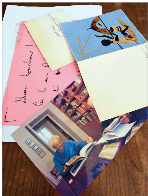
fig. 4. Le fotografie emergono da scatole e cassette, album e diari. La loro componente materica diventa un potente elemento attrattivo e mnemonico. (Marzo-maggio 2020. Foto: B.M. Sciré).

contrasto stridente tra la produzione di memorie visive del presente, completamente dematerializzata, e il rapporto con quella del passato, dove la materia (la carta ingiallita, gli album, ecc...) sono parte sostanziale dell'esperienza. Molte donne approfittano del tempo passato in casa per andare a ricercare vecchie fotografie e album che conservano in scatole e ripostigli; riguardarle e ordinarle, attiva meccanismi mnemonici veicolati attraverso la materia che coinvolgono non solo la vista, ma anche il tatto, richiamando luoghi, persone e racconti, associando alla nostalgia il piacere di ritrovare ricordi lontani (fig. 4).