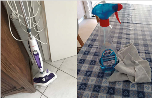
fig. 3. Attrezzi e prodotti dedicati alla pulizia della casa sono ritratti da molte donne come protagonisti delle loro giornate. (Marzo 2020.).

allora che quella che oggi ormai appare come una competenza tecnica acquisita, si rivela, agli inizi del lockdown, come qualcosa di completamente nuovo. I telefoni, fino a quel momento usati essenzialmente per telefonare, scambiare messaggi, interagire all'interno dei social media, ascoltare musica, scattare fotografie, acquisiscono queste loro funzionalità e ne acquisiscono di nuove. Questi oggetti diventano essenziali per vincere l'isolamento, ma anche per garantire la formazione e il lavoro.