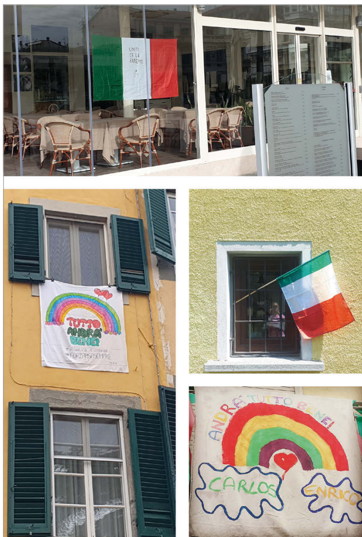
fig. 1. Manifestazioni materiali rivolte verso l'esterno che rimandano a un'idea di speranza nel superamento del momento di crisi. Prevalgono il simbolo dell'arcobaleno e il tricolore della bandiera italiana (Marzo 2020. Foto: F. Anichini, L. Mazzella).

I media continuano a fornire e commentare quotidianamente gli indici e i dati del contagio che descrivono un fenomeno epocale 3 . Sullo sfondo le città svuotate, le immagini delle più famose mete turistiche che sembrano immobili e silenziose; del 27 marzo è l'immagine, quasi cinematografica, di una deserta Piazza San Pietro sferzata dalla pioggia e attraversata dal solo papa Francesco che prega perché la pandemia abbia fine.