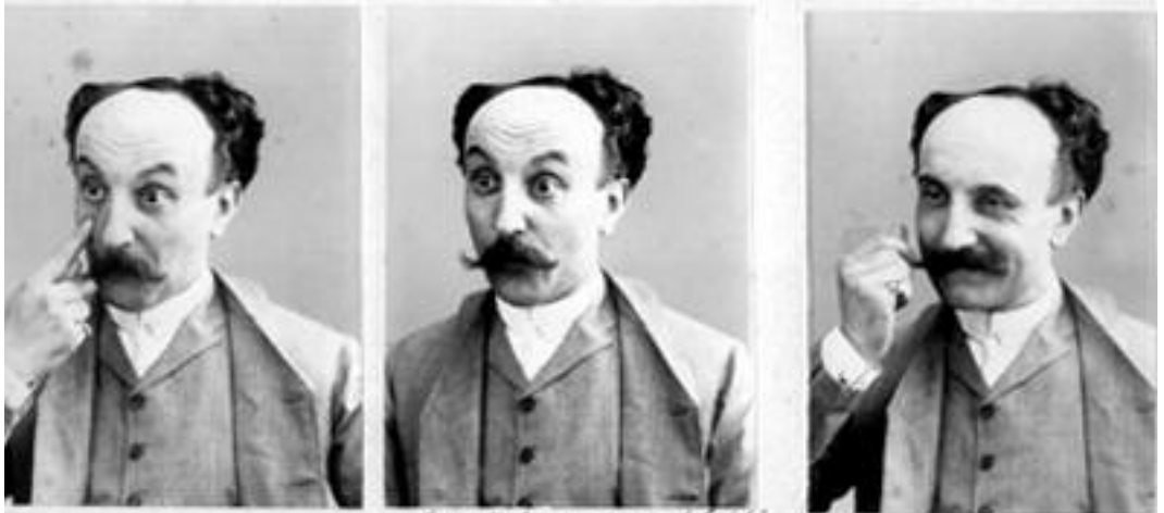
Tre gradi di calvizia: capelli (tagliati).