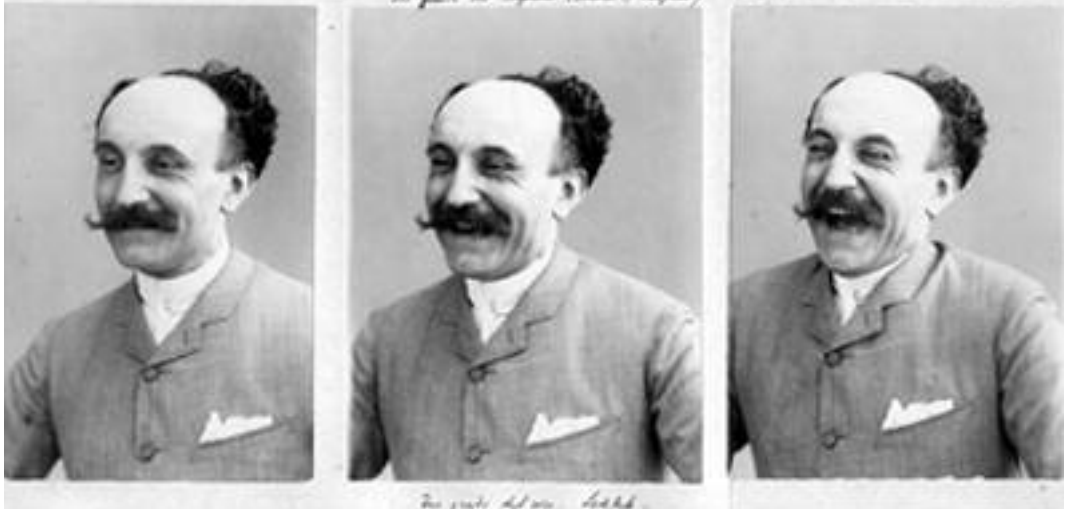
Tre gradi della calvizia.