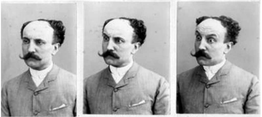
Tre gradi della calvizia: capelli sull'occipite tagliati.