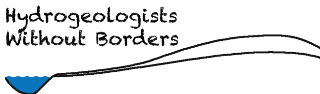
Fig.1 - Logo dell'associazione Hydrogeologists Without Borders ( http://hydrogeologistswithoutborders.org/wordpress/ ).

L'attività di traduzione rientra nell'ambito di un progetto iniziato per volere dello stesso autore, John Cherry (Università di Waterloo, Canada), che ha deciso di donare il ricavato dei suoi diritti d'autore all'associazione Hydrogeologists Without Borders (HWB; Fig. 1). Quest'ultima è una organizzazione no profit canadese, che da anni si impegna a fornire un supporto di carattere idrogeologico all'interno di progetti di sviluppo delle risorse idriche e di problemi igienico-sanitari (WASH -Water, Sanitation and Hygiene).