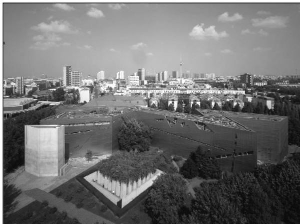
Veduta del Museo ebraico di Berlino.

"Contributo e destino: 300 anni della Comunità ebraica a Berlino, 1671-1971". A seguito di ciò nell'amministrazione cittadina si fece strada la volontà di dotare il museo di un "dipartimento ebraico", e si aprì un dibattito sulle relazioni tra il museo di storia cittadina e le collezioni di storia ebraica. Infine, nel 1988, fu sancita la necessità di un nuovo edificio per il dipartimento ebraico. Il concorso internazionale indetto in quell'anno recava il titolo "Estensione del Museo di Berlino con il dipartimento museale ebraico" e la sede eletta per la realizzazione dei nuovi spazi fu proprio quella della Lindenstrasse. I 165 concorrenti dovevano perciò inserire, accanto a un edificio settecentesco di prussiana eleganza e austerità, un nuovo grande museo che consentisse l'esposizione permanente della collezione ebraica ed eventuali mostre temporanee, contributi di-