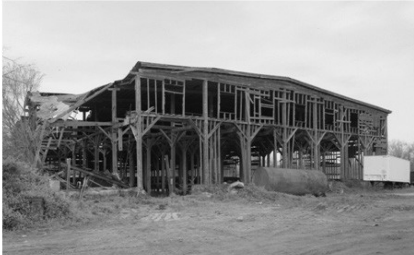
Figura 1: Costruzione in legno complessa

Il concetto architettonico di tettonicità, sussumibile nel principio di pianificazione, approda alla germanistica grazie alla ricezione, in ambito di studi letterari, dell'opera dello storico dell'arte Heinrich Wölfflin. 6 In Wölfflin, tettonicità e atettonicità si presentano come concetti polari equivalenti alla coppia 'forma chiusa' e 'forma aperta'. Il significato delle due coppie si evince dalla caratterizzazione dei corrispondenti stili, lo stile 'tettonico' e quello 'atettonico', i quali possono riguardare singole opere d'arte come pure intere epoche storico-artistiche. Lo stile tettonico risulta dalla ponderata valutazione del rapporto tra la struttura e lo spazio circostante, quale si palesa nell'arte rinascimentale, rappresentata ad esempio dal pittore fiammingo Joachim Patinir: