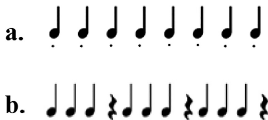
FIGURA 1. Gruppi ritmici: a. gruppo ritmico isocrono con notazione esecutiva a modo di staccato; b. tre gruppi ritmici isocroni consecutivi separati da pause dal valore di un quarto (semiminima).

cipi, quindi, le pause giocano funzioni diverse: funzione espressiva o pragmatica (1); funzione strutturale (2); funzione fisiologica (3); funzione dialogica (4). Prendiamo ad esempio due strutturazioni ritmiche semplici come quelle presentate nella figura 1. Il primo esempio (1a) presenta quello che viene considerato un gruppo ritmico con intervalli di durata isocroni (semiminime) all'apparenza senza pause esplicite. Il secondo (1b) presenta invece più gruppi ritmici isocroni consecutivi costituiti da semiminime intervallate da pause della medesima durata.